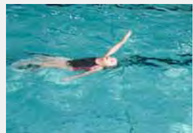
50 m schwimmen