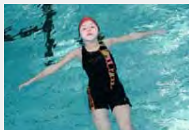
1 Minute an Ort über Wasser halten