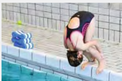
Rolle/purzeln in tiefes Wasser